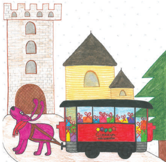
Oficjalna kartka bożonarodzeniowa Cieszyna 2023 Autor: Bartek Płonka