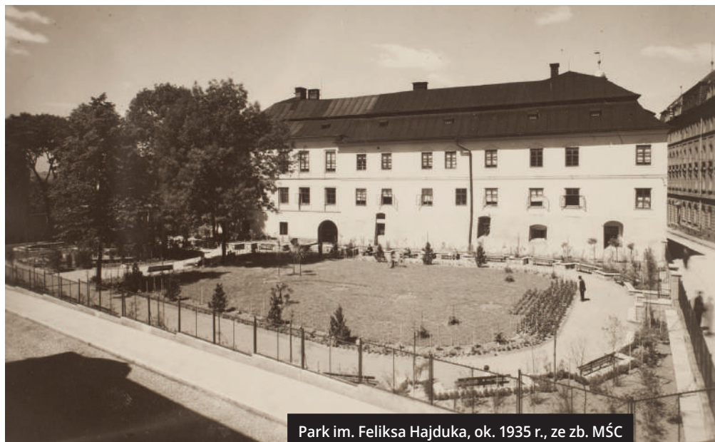
Park im. Feliksa Hajduka, ok. 1935 r.