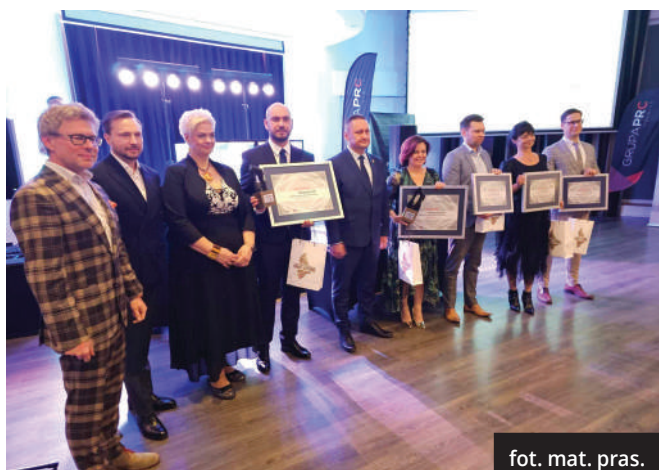
fot. mat. pras.